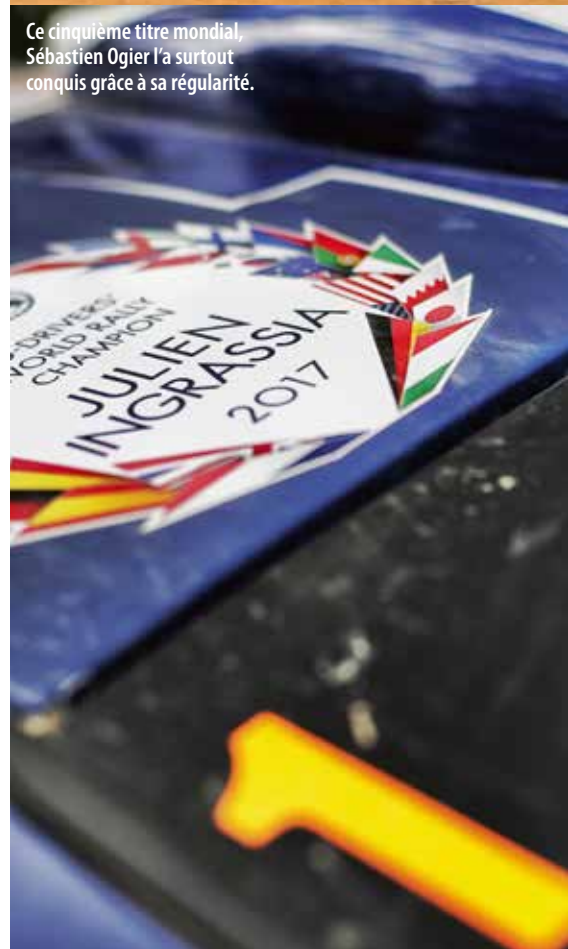
Ce cinquième titre mondial, Sébastien Ogier l'a surtout conquis grâce à sa régularité.