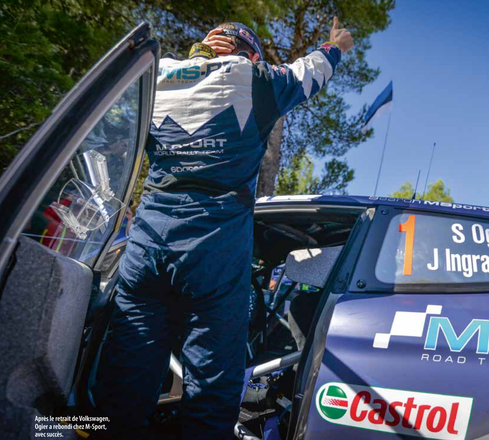
Après le retrait de Volkswagen, Ogier a rebondi chez M-Sport, avec succès.